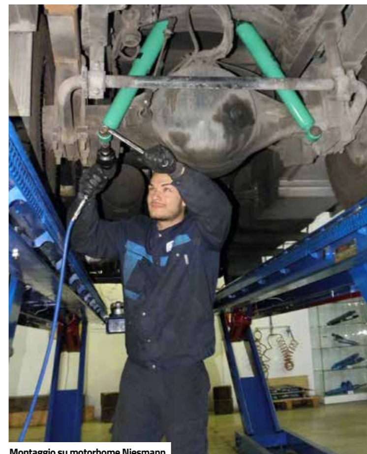
Montaggio su motorhome Niesmann