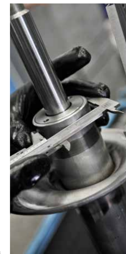
Tre fasi di assemblaggio e controllo ammortizzatori

Per info e contatti: OMA - tel. 055 8719674 - posta@ammortizzatorioma.it - www.ammortizzatorioma.it