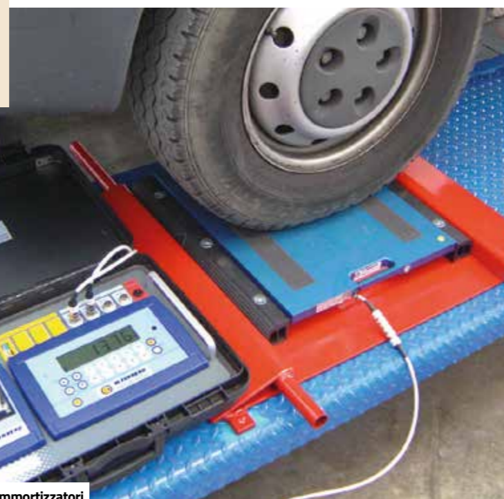
Pesatura per taratura ammortizzatori

La OMA commercializza ammortizzatori e sospensioni di propria produzione, più parti accessorie come il kit Bleu descritto in un paragrafo a parte o di supporto come i soffietti ad aria o le balestre. L'azienda fiorentina progetta, costruisce, assembla, vernicia e controlla in casa i suoi prodotti, tutto realizzato in casa con materiali di alta qualità e Made in Italy perché sulle sospensioni non si scherza, sono l'anello vitale della tenuta di strada del veicolo. Gli ammortizzatori OMA, costruiti artigianalmente in ognuno dei componenti, rispettano specifiche tecniche di standard elevato, dallo stelo cromato e rettificato alla saldatura che risponde alle normative UNI EN 15614.1 e UNI